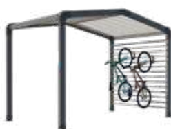
Range-vélos et/ou stockage