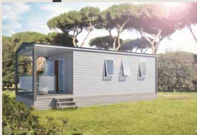
Modèle présenté avec l'option rambarde métal et toile