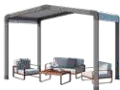
Espace de détente