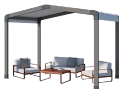
Espace de détente