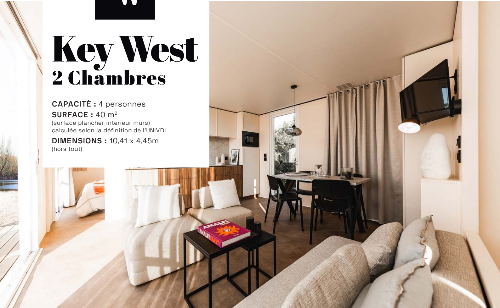
Cuisine présentée avec l'option micro-ondes intégré

Un écrin de luxe, particulièrement confortable avec ses deux suites parentales et enfants/invités, pour un standing inégalé en hôtellerie de plein air. La baie coulissante 3 vantaux de la façade arrière augmente instantanément l'habitat, invitant la nature et le soleil à entrer, à toute heure de la journée.